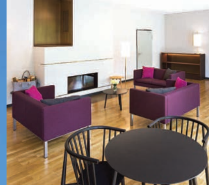
Kaminzimmer mit Bereichen für gemeinsame Gespräche.