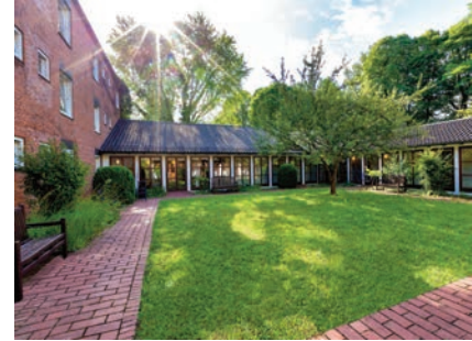
Innenhof des Studienseminars.

EIGENBEITRAG für Einzelzimmer, Verpflegung (am Wochenende Halbpension) und Kurskosten incl. USt. 148 € für Teilnehmende aus den VELKD-Gliedkirchen, sonst 721 €