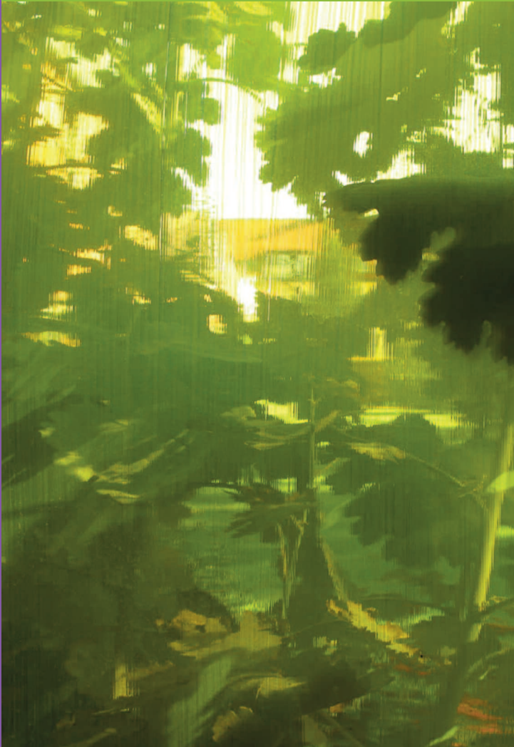
Fotos auf Vorder- und Rückseite vom „Pullacher Farbfenster“ des Starnberger Malers Stefan Moritz Becker, 2011, bemaltes Fenster, 24 Scheiben, zusammen 504 x 515 cm

Bischof-Meiser-Straße 6 82049 Pullach Tel.: 089 7448529-0 Fax: 089 7448529-6 info@velkd-pullach.de www.velkd.de/pullach