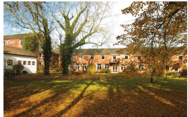
Das Studienseminar – weitläufiger Komplex mit Gästezimmern, Seminarräumen, Bibliothek, Kapelle, eigener Küche und großem Garten