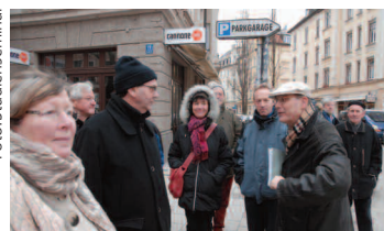
Thematische Führung durch München – hier auf den Spuren Thomas Manns in Schwabing