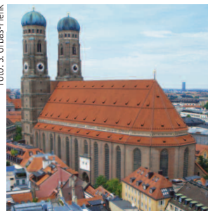
Blick vom Turm des Münchner Rathauses hinüber zur Frauen- kirche