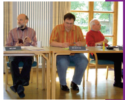
Gemeinsame Studienarbeit im Lehrsaal

Im Mittelpunkt dieses Kurses stehen die Oratorien Johannes-Passion (Uraufführung 2000) und JohannesOstern (Uraufführung 2002) der russisch-tatarischen Komponistin Sofia Gubaidulina. In ihrem Werk fließen russische, tatarische und westeuropäische Musiktraditionen zusammen. Die Komponistin versteht sich als religiöser russisch-orthodoxer Mensch. Sie setzt mit ihrer Musik dem Staccato des Lebens heute ein Legato entgegen im Sinne von religio, d.h. Wiederherstellung der Einbindung. Wir werden musikwissenschaftlich in ihr Werk eingeführt, vergegenwärtigen uns aktueller Entwicklungen in der exegetischen Johannes-Forschung und gehen der Bedeutung von Kreuz und Auferstehung in der orthodoxen Theologie und Liturgie nach. Frau Gubaidulina hat einen Besuch in Pullach in Aussicht gestellt. Zu dem Kurs sind Pfarrerinnen und Pfarrer, Kantorinnen und Kantoren sowie kirchenmusikalisch Interessierte eingeladen. Gemeinsam wollen wir theologisch und musikwissenschaftlich arbeiten, uns mit dem zeitgenössischen musikalischen Umgang mit Passion und Ostern befassen und musizieren.