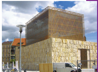
Die Münchener Haupt- synagoge am Jakobs- platz – ein beliebtes Exkursionsziel

die er auch anhand der Josephsgeschichte entfaltet. Im Gespräch mit diesen Auslegern wollen wir Altes und Neues entdecken über die Geschichte Gottes mit den Menschen, die sich auch heute ereignet.