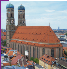
Blick vom Turm des Münchner Rathauses hinüber zur Frauenkirche