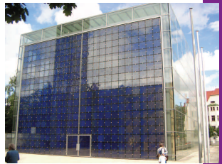
Die Münchener Herz-Jesu-Kirche – beeindruckendes Beispiel neuer Sakralarchitektur in Deutschland.

praktisch-theologischen Fokus schärfen. Über allem die eine Frage – O-Ton Christian Stückl, das dritte Mal in Folge Spielleiter: „Wie kann man Glaubensdinge auf die Bühne bringen? Wie Auferstehung, wie die Abendmahlsszene darstellen? Jesus – ganz Mensch und zugleich Gott. Eigentlich eine unmögliche Aufgabe.“ Wir werden uns das Passionsspiel am 18.9.2010 vor Ort anschauen und mit Akteuren und Verantwortlichen für das Passionsspiel sprechen.