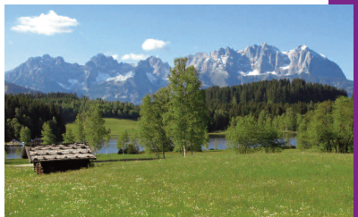
Wanderungen in den Alpen gehören zum Programm