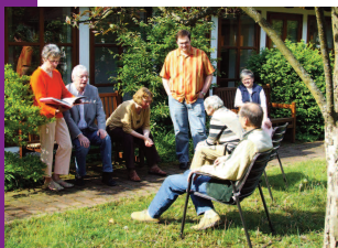
Der Innenhof – Ort für Gruppen- arbeit und Pausen- gespräch